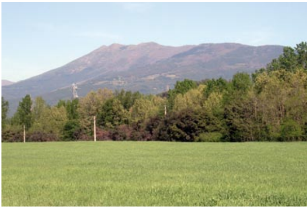
Vistes del Turó de l'Home

Deixem algun trencall secundari a dreta i esquerra fins arribar als 9.600 m (1h 40 min) . Deixarem la pista principal per agafar la bifurcació de l'esquerra. Passem per can Carbonell ( 10.100 m, 1h 45 min ). En acabar la pista girem a la dreta per un tram asfaltat, per passar per sota de les vies de l'AVE i a uns 50 metres deixem la pista asfaltada per agafar un camí a l'esquerra. I en poca estona estem a la passera de la Serra ( 10.400 m, 1h 55 min ).