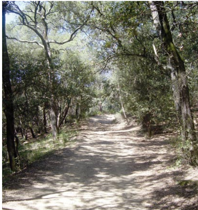
Camí cap a la Serra de Can Batalla

Als 3.300 metres trobem una segona cruïlla, trenquem a la dreta. Aviat passem pel punt més alt de la carena ( 330 m ). Posteriorment, entre boscos de pins i alzines creuem algunes línies elèctriques.