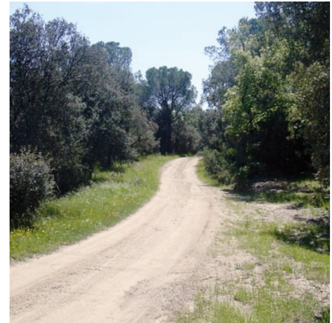
Camí cap a la Serra de la Mare de Déu

Troblem un primer trencall important a la dreta, no l'hem d'agafar ( 5.600 m, 1h 290 m alt. )