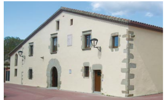
Masia de Can Rahull

Passem per davant de can Rahull, actualment seu provisional de l'ajuntament. Seguint pel mateix carrer trobem el parc Pau Casals, agafem el passeig del Remei a mà esquerra, de pujada (1.460 m, 20 min) si volem visitar l'Ermida del Remei. O bé per acabar el passeig, baixar pel passeig fins al carrer Major i tornar a l'Ajuntament fent un recorregut curt.