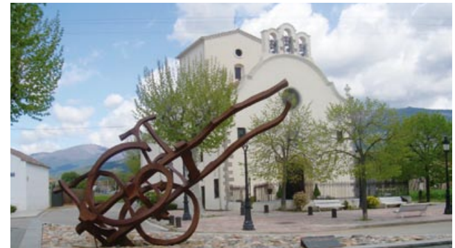
L'Ermida del Remei

Passem per davant de can Rahull, actualment seu provisional de l'ajuntament. Seguint pel mateix carrer trobem el parc Pau Casals, agafem el passeig del Remei a mà esquerra, de pujada (1.460 m, 20 min) si volem visitar l'Ermida del Remei. O bé per acabar el passeig, baixar pel passeig fins al carrer Major i tornar a l'Ajuntament fent un recorregut curt.