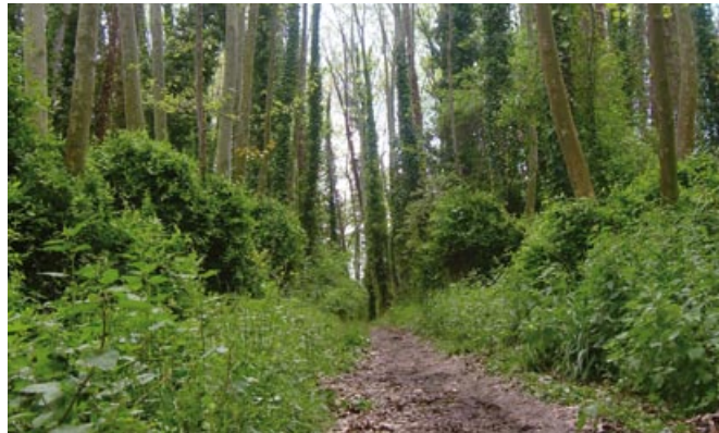
Camí al costat del Reguissol

Enfilem pel camí clar el curs del riu fins trobar una pista asfaltada (750 m, 10 min), l'agafem recta, deixant el carrer a la dreta. El Reguissol, en aquest tram, sempre ens ha de quedar a l'esquerra.