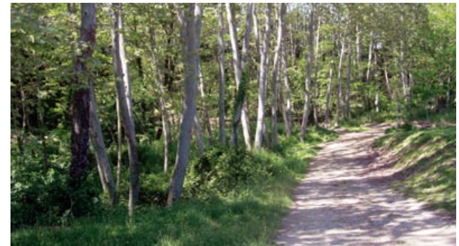
Passejant per la Tordera

Trencant a la dreta, deixem definitivament el Reguissol, fem la pujada, travessem el primer carrer i agafem el carrer Empordà.