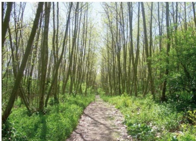
Llera del Riu Tordera

Travessem el parc fins al final, just en sortir a mà esquerra ens queden unes escales que baixen un fort pendent fins a La Tordera. Les agafem, en arribar a baix ( 2.570 m, 33 min ), podem observar uns murs de pedra seca, que van fer a principis del segle XX, per contenir la força del riu. Aquets murs, lligats amb xarxa, es poden observar en pocs llocs. Trobem un camí a mà dreta que haurem de seguir fins al final. El bosc de plataners es frondós, és un paratge tranquil, assossegat.