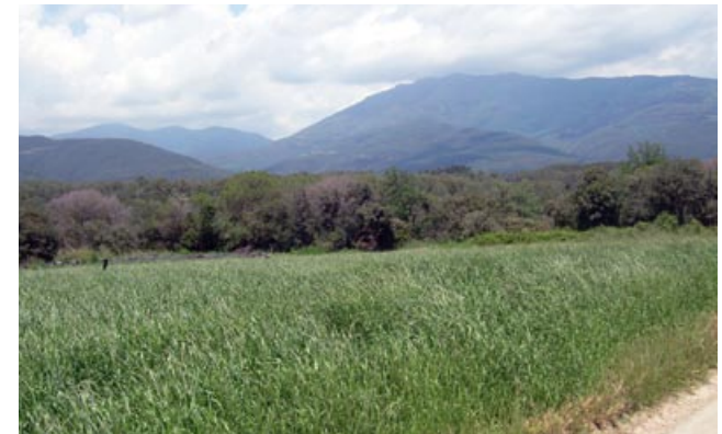
Vistes al Turó de l'Home des de Can Peualt

tren, deixem un trencall a la dreta i ens enfilem per anar a passar per un pont per sobre la via de l'AVE (6.000 m, 1h 10 min). Just passat el pont tombem per la pista de l'esquerra per seguir pujant. Deixem diversos trencalls, clarament secundaris, a l'esquerra. A dalt del coll girem a la dreta, seguim el senyal que indica cap al "turó de les Formigues" (6.500 m, 1h 20 min, 270 m alt.) Seguim la pista principal deixant trencalls a dreta i esquerra, fins al final de la pista (8.000 m, 1h 40 min) on anem a la dreta, en direcció a la urbanització can Ram (hi ha una senyalització que ho indica). Al cap de poca estona estem a Sant Antoni de Vilamajor, entrem a la urbanització can Ram (8.300 m), pel carrer Rosa Sensat, el seguim, girem a la dreta pel carrer Ferran Soldevila i seguidament a l'esquerra pel carrer Dr. Trueta que seguim fins al final per continuar recte pel carrer del Pi (9.200 m, 1h 55 min). Caminem fins a torçar a l'esquerra pel carrer Alzina, seguint l'indicatiu de "sortida a Vallserena". Al final del carrer seguim la pista asfaltada (9.600 m, 2h 10 min), on podem veure magnífiques vistes del turó de l'Home i de la vall de la Tordera.