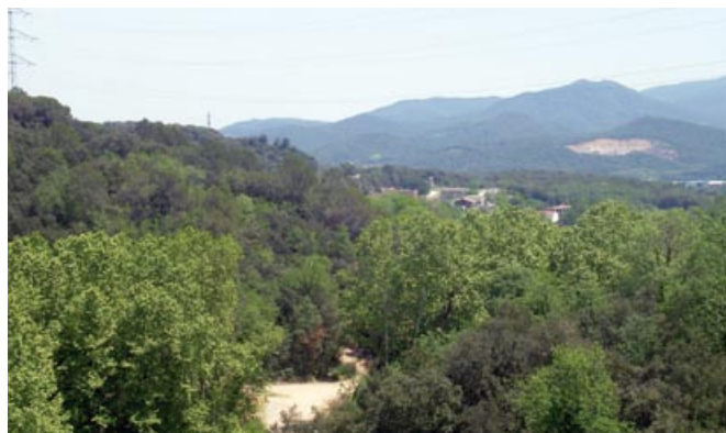
Vistes del masís del Montseny des de la Serra Llarga