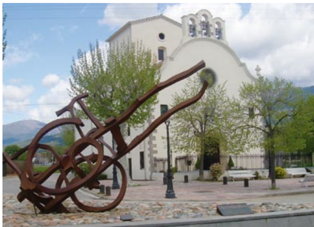
l'Ermita del Remei

40 min, 230 m alt. ) Travessem la urbanització recte, fins al pont que creua el torrent Reguissol, seguim per pista asfaltada fins creuar la carretera de Sant Esteve. La creuem i seguim recte fins arribar a l'ermita del Remei ( 13.700 m, 2h 50 min ) on també val la pena observar la capella de Sant Sebastià.