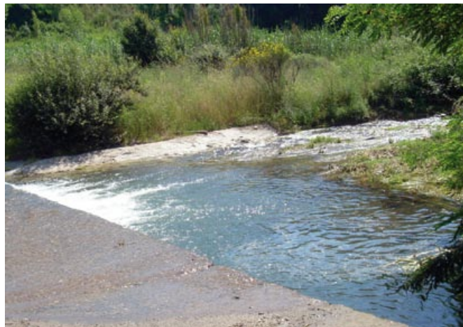
Riu Tordera, sota el molí de Can Balada

Inicialment va ser un molí d'oli i blat. Molt posteriorment, a inicis del segle passat, va passar a ser un molí tèxtil i durant la primera meitat del segle XX va ser la primera empresa elèctrica, que va donar llum al poble (Arimany).