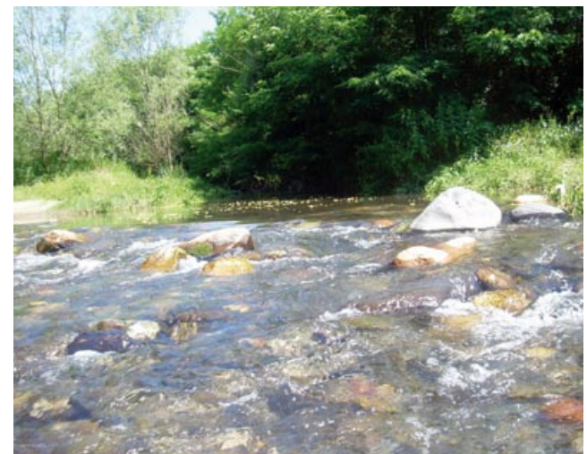
La Tordera sota Can Pagà

Podem observar magnífiques vistes del Montnegre.