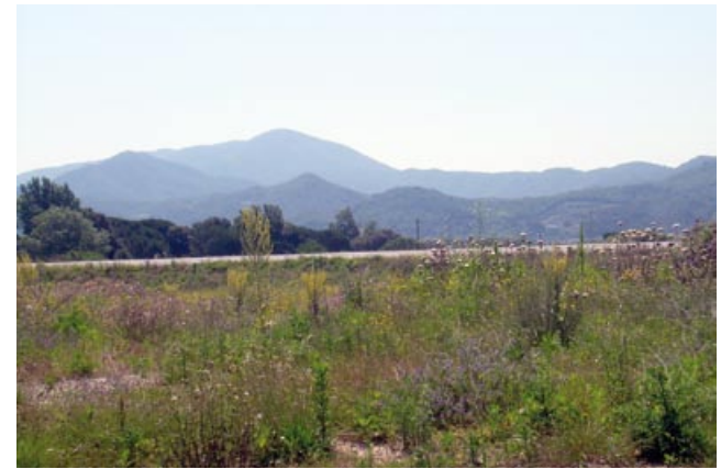
De camí cap al Pedrenyal Vell

Retornem a la rotonda i girem a l'esquerra, passant per davant de l'escorxador i la deixalleria, arribem a una altra rotonda, que fem recte ( 850 m, 9 min ). Entrem al barri de la Serra (hi havia hagut una serradora) i seguim per l'avinguda de la Serra fins al final, ( 1.650 m, 17 min ) trobem un corriol que baixa cap a la Tordera, la travessem per una passera de ferro ( 1.700 m ). Al final hem de girar a l'esquerra fins arribar a l'asfalt, on girem a la dreta per passar per sota les vies de l'AVE ( 1.950 m, 20 min ). Just sortir agafem el camí de la dreta que ens porta directament davant de can Guarro ( 2.180 m, 23 min ).