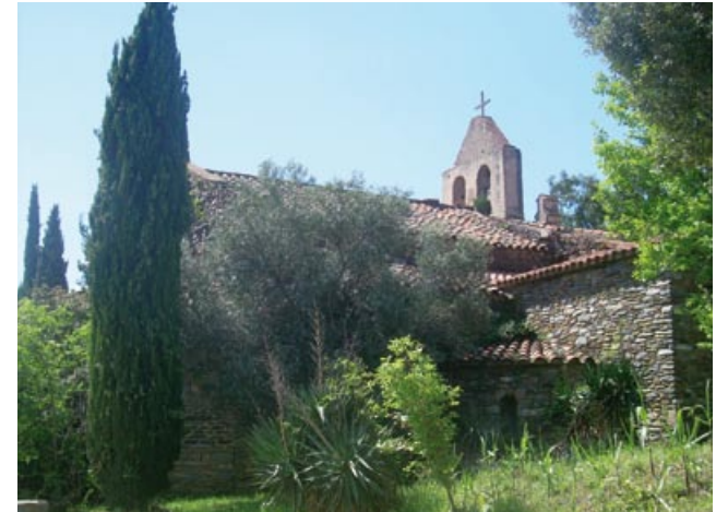
Ermita Santa Magdalena

Ens trobem enmig de boscos d'alzines, sureres i pins; passem prop de diversos masos habitats i amb camps de conreu: can Mateu, can Peugran, cal Picolí, ca l'Albert de Baix, can Pau Gros, can Boter... Preguem que es tingui el màxim respecte pels camps i pel bestiar.