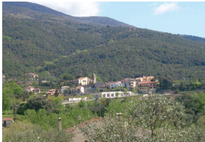
Vistes de Mosqueroles

Seguim la pista principal, deixant camins i masies a dreta i a esquerra fins a un trencall ( 15 min, 1.500 m, 230 m alt. ) agafem el de la dreta donant la volta a uns camps. 2.100 m cruïlla, continuem per la pista principal deixant el camí de la dreta. Seguim la pista principal deixant trencalls clarament secundaris a dreta i esquerra. Podem gaudir de magnífiques vistes al massís del Montseny, i a la vall de Mosqueroles.