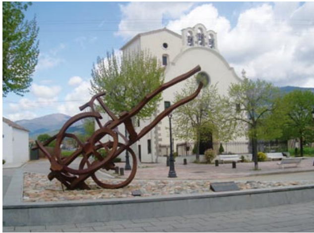
l'Ermita del Remei

Baixem pel passeig del Remei, zona de vianants, passant pel costat del Parc Pau Casals fins arribar al carrer Major, baixem el carrer Major fins a la plaça Major, seguim el carrer Major fins trencar a l'esquerra pel carrer Sant Burget i arribem a la plaça de la Vila ( 10.400 m, 1h 55 min ).