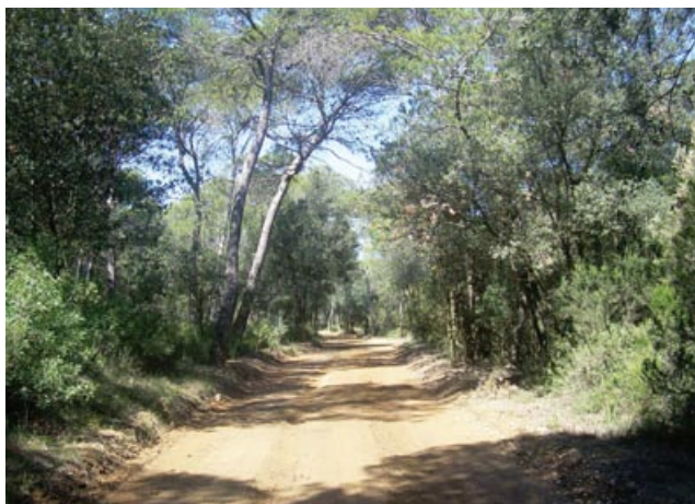
Vista del camí de la Serra de Pinell

Tombem a la dreta pel primer carrer asfaltat (passeig de circumvallació) fins arribar al carrer del Faig (1h 20 min.) on girem a la dreta i el seguim fins a l'avinguda dels Bruguers. Iniciem la baixada de l'avinguda dels Bruguers i als pocs metres trobem un camí a l'esquerra, una pista forestal, l'agafem (8.000 m, 1h 25 min.). Passem per davant la masia can Lluís, seguim el camí fins arribar a l'asfalt, que no agafem. Fem un gir brusca a l'esquerra i anem fins a la porta del darrera del parc del Reguissol (8.930 m, 1h 35 min.) Entrem al parc i el travessem (9.250 m), pugem les escales, pugem una mica més per trobar el pas de viants i travessem la carretera. Som a la plaça Major, que hem de travessar. Girem pel carrer Major a la dreta, uns 50 metres i torcem a l'esquerra pel carrer Sant Burget per arribar a la plaça de la Vila (9.200 m, 1h 45 min.).