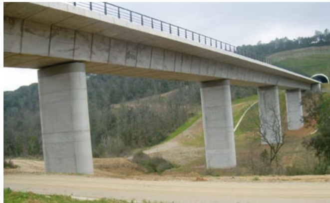
Pont de l'AVE

Passem per sota la via de l'AVE (4.050 m, 40 min). La pista torna a estar en bon estat, continuem sempre per la pista principal, seguint el curs de la riera, deixant els trencalls